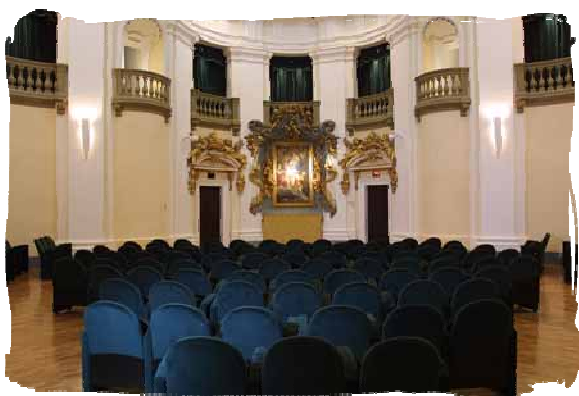
SALA TEATRO ORATORIO SANTA CECILIA VIA DELLA STELLA

PRANZO DEGLI AUGURI (RISTORANTE DEL SOLE – VIA DELLA RUPE 1 - PINCETTO)