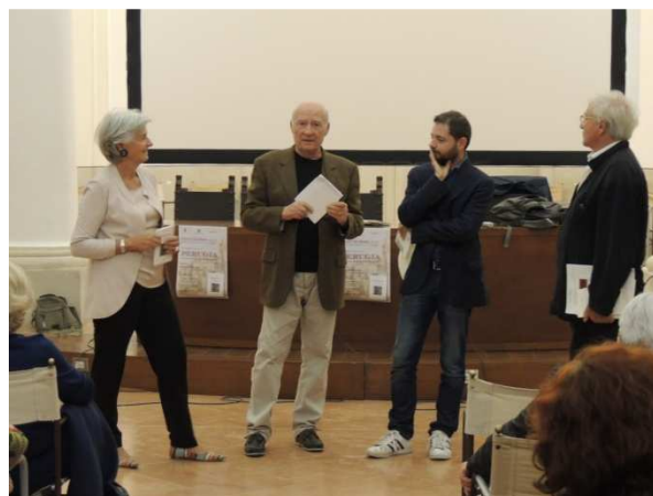
Ricordo di Aldo Capitini